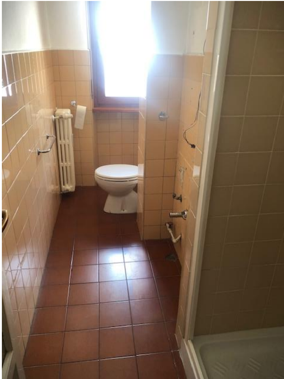
Vista del bagno