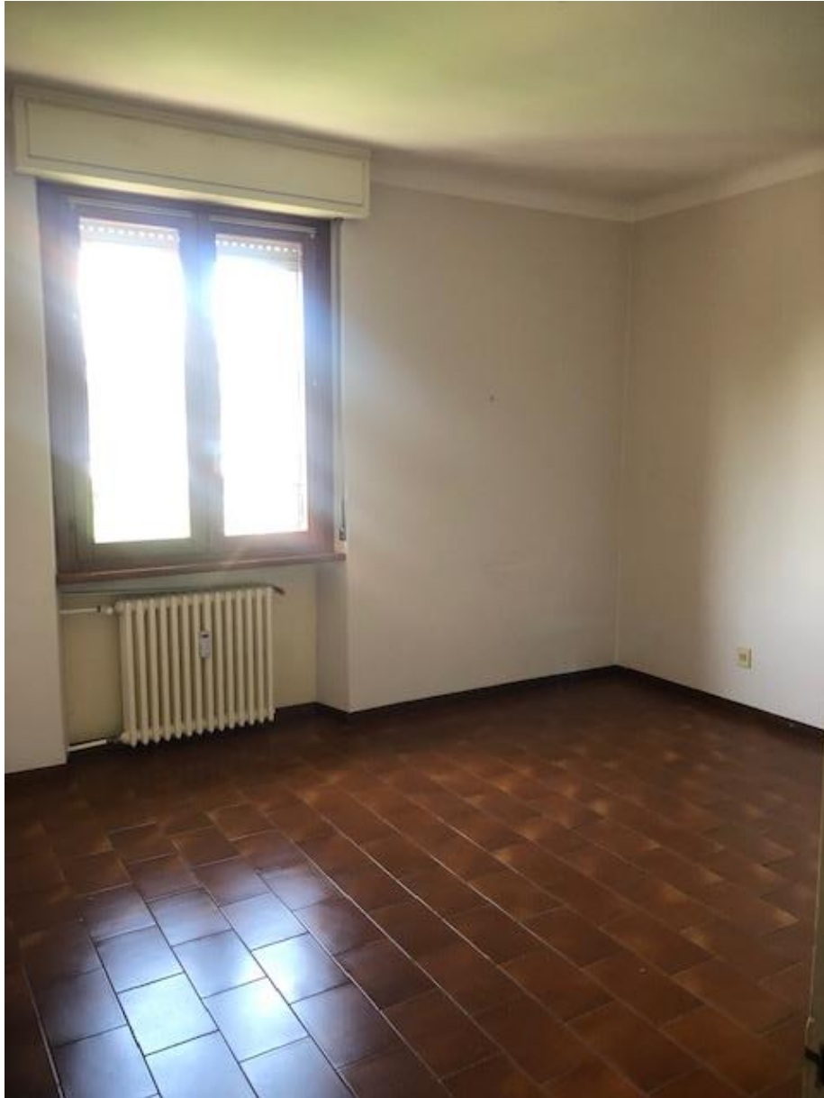
Vista della camera 1