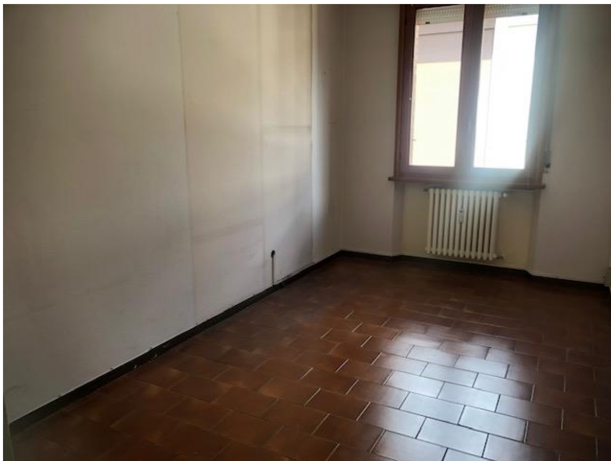
Vista della camera 2