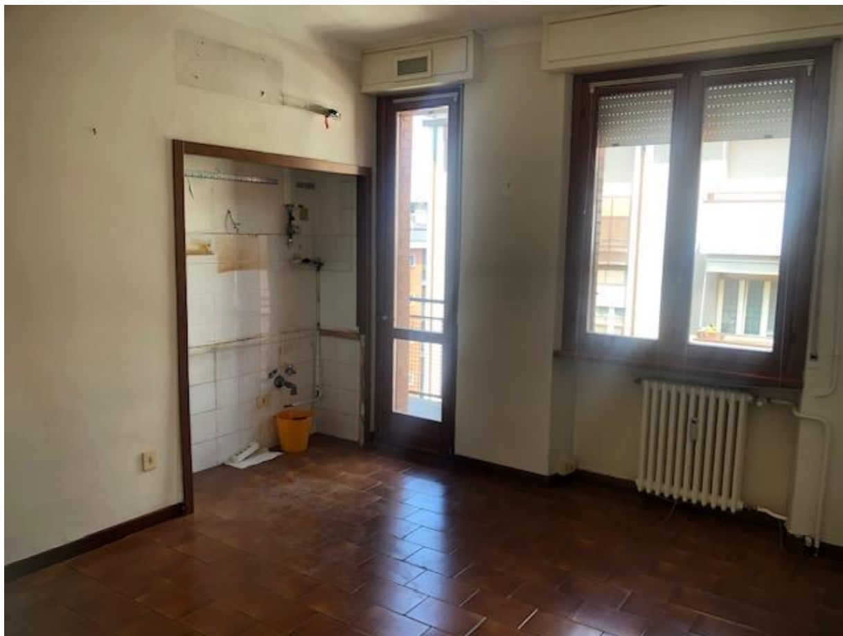
Vista del soggiorno

Alloggio: TRE15.59, Via Trenno 15, Scala B11, P5